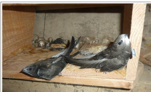
Bei unserer letzten Sichtkontrolle am 22.08 ließen sich die beiden Jungvögel bereitwillig ablichten.

Die Naturschutzstiftung des Landkreises Osnabrück hat uns Mittel zur Verfügung gestellt, um auf unserer Homepage im nächsten Jahr das Brutgeschäft eines Mauersegler Paares live verfolgen zu können. Dafür möchten wir uns an dieser Stelle recht herzlich bedanken.