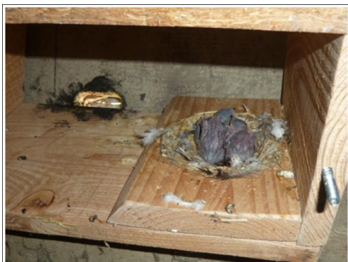
Sichtkontrolle am 28.07.2022 um 16 Uhr 28

Scheu von uns fotografieren ließ, dabei dann allerdings die Nistmulde verdeckte. Eine Nachkontrolle nach 2 Tagen bestätigte unsere Vermutung, dass bereits in diesem Jahr eine erfolgreiche Brut stattfand. Zwei Jungvögel, ca. 10 Tage alt lagen in der Nistmulde.