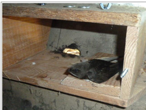
Sichtkontrolle am 26.07.2022 um 16 Uhr 50

Player ausgestattet, um durch Abspielen von Mauerseglerrufen die Vögel auf das Nistangebot aufmerksam zu machen. Schon nach kurzer Zeit konnten den Turm umkreisende Mauersegler beobachtet werden. In der Folge kam es dann bereits zu abendlichen Einflügen und Übernachtungen. Erstaunt waren wir, als wir am 26.07. bei einer Kontrolle, einen Mauersegler im Kasten antrafen, der sich ohne