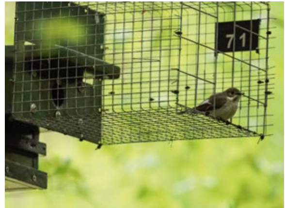
Abb. 4: Nistkästen des Vereins für Natur- und Vogelschutz Villingen mit Waschbärschutz. - Nestboxes with protection gates against Raccoon predation made by the association for nature and bird protection Villingen.