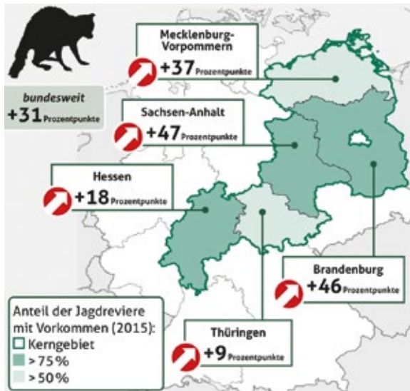
Abb. 1: Zunahme der Waschbären im Kerngebiet der Verbreitung 2006-2015. Grafik erstellt vom Deutschen Jagdverband aus Daten des Wildtier-Informationssystems der Länder (WILD). - Increase of Raccoons in the core area of the distribution in 2006-2015. Figure created by the German Hunting Association from data from the wild animal information system (WILD).

der dem Jagdrecht unterliegenden Arten finanzielle Unterstützung für eine „Nationale Strategie gegen invasive gebietsfremde Arten“ gefordert. Eine effektive Fangjagd mit Fallen würde eine wirkungsvolle und zielgerichtete Bejagung dieser Problemart ermöglichen. Tierschutzverbände dagegen lehnen die Tötung von Tieren ab und plädieren für eine „Unfruchtbarmachung“. Der Deutsche Jagdverband hält dies vor dem Hintergrund der starken Ausbreitung von Arten wie dem Waschbären für utopisch.