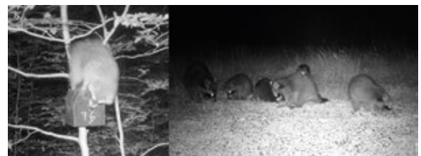
Abb. 2: Kamerafallen-Aufnahmen von Waschbären: links am Nistkasten, rechts an einer Futterstelle. - Camera trap pictures of Raccoons: left at the nest box, right at a feeding place.

Dieses Beispiel sowie Berichte über die Prädation von Nistkästen durch Waschbären in anderen Gebieten Deutschlands (z. B. Harz: Tolkmitt et al. 2012; Sachsen: Schrack 2010) verdeutlichen die Notwendigkeit einer Schutzvorrichtung für Nistkästen. In der Literatur sowie in Internet sind dazu noch wenige Informationen verfügbar. Die Lösungsansätze beziehen sich zum Teil auf Vorrichtungen, um ein Erreichen der Nistkästen von unten zu verhindern (z. B. https://nestwatch.org/learn/all-about-birdhouses/dealing-with-predators/ ), zum Beispiel durch glatte Metallflächen. Das ist jedoch nur bei freistehenden Nistkästen möglich, während im Wald die Kästen auch über benachbarte Bäume erreichbar wären. Alternativ sind Schutzgitter um das Eingangsloch („Noel Guards“) verwendet worden